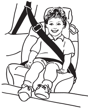
D. Silla elevadora asegurada al cinturón de seguridad