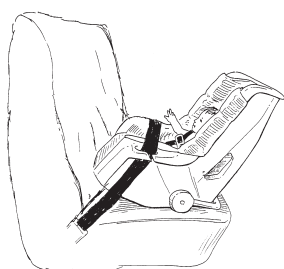
B. Silla convertible mirando hacia atrás